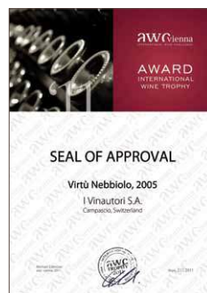
Virtù 2005, Siegel 86,1 Punkte