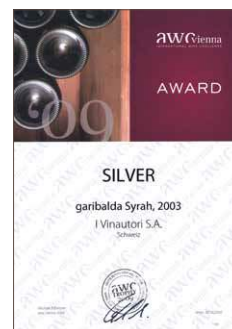
Garibalda 2003, Silber