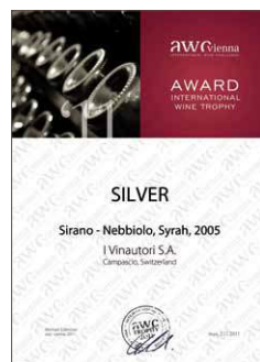
Sirano 2005, Silber 88,3 Punkte