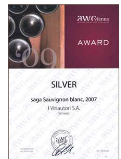
Saga 2007, Silber