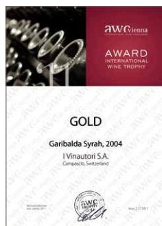
Garibalda 2004, Gold 92,1 Punkte